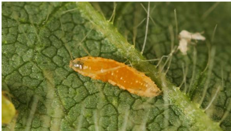
۴-۲- لارو پشه‌ی A. aphidimyza (اصل)