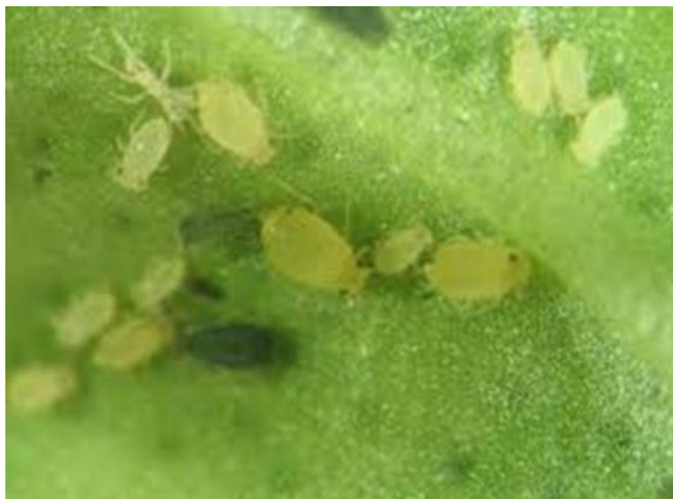
شکل ۲-۲- مراحل مختلف زیستی شته‌ی جالیز (اصل)

بوده و شکم به رنگ سبز مایل به زرد می‌باشد. اندازه‌ی بدن شته‌های بالغی که در جمعیت‌های زیاد و دمای بالا تولید می‌شوند ممکن است کمتر از یک میلی‌متر بوده و رنگ آن‌ها زرد روشن تا سفید باشد. شاخک در این شته شش بندی بوده و طول آن تا قسمت میانی بدن و یا کمی جلوتر از بدن می‌رسد. طول دم در این شته در حدود یک سوم اندازه‌ی بدن بوده و روی آن ۲ تا ۳ جفت موی جانبی روشن تا خاکستری وجود دارد (Blackman and Eastop, 2000; Capinera, 2001).