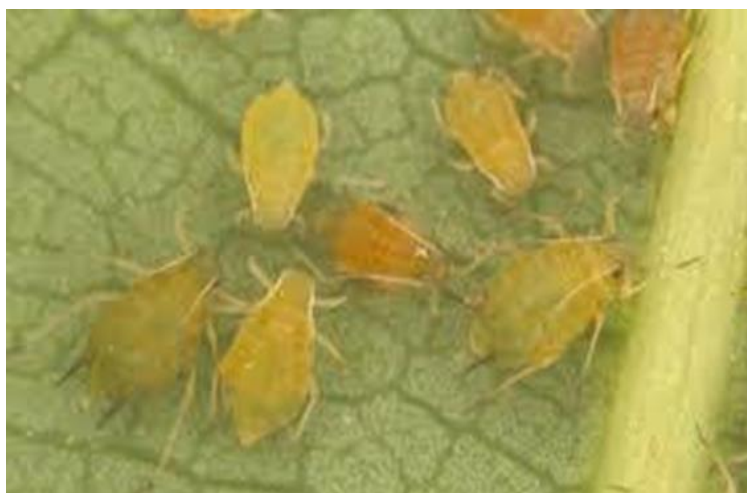
شکل ۱-۲- شته‌ی جالیز در سطح پشتی برگ خیار (اصل)

شته‌ی جالیز حشره‌ای چند شکلی با اختلافات قابل توجه در رنگ و اندازه است که در چرخه‌ی زندگی آن بسیار اهمیت دارد (شکل ۲-۱). شکل زرد رنگ شته در فصل گرم تابستان دیده می‌شود، در حالی که شکل سبز رنگ آن، از نظر اندازه نیز بزرگتر است و در طول فصل بهار که دمای هوا خنک‌تر است، قابل مشاهده می‌باشد. در دماهای پایین‌تر و طول روزهای کوتاه‌تر شته‌های تیره رنگی ایجاد می‌شوند. بنابراین، رنگ شته‌ها به نوع میزبان وابسته نبوده بلکه متاثر از شرایط آب و هوایی منطقه‌ی مورد نظر می‌باشد. رنگ پوره‌ها قهوه‌ای مایل به زرد، خاکستری و یا سبز است (Dixon, 1987; Blackman and Eastop, 2000).